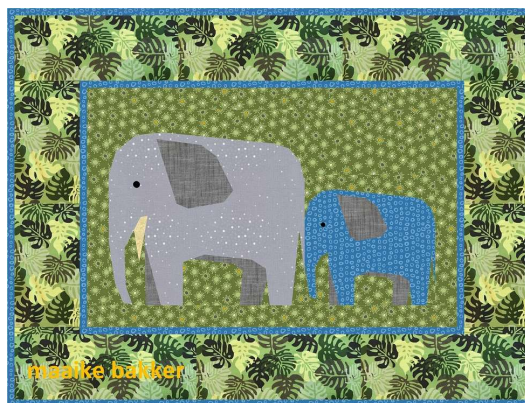
Olifantje in het bos blauw