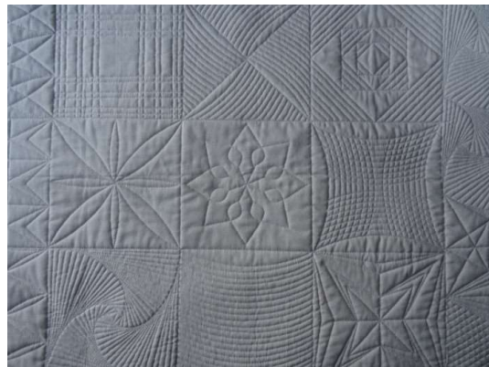
Genaaid met Westalee mallen