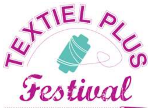
Een nieuwe quiltwedstrijd